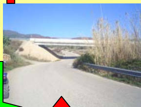
Carretera de saletas